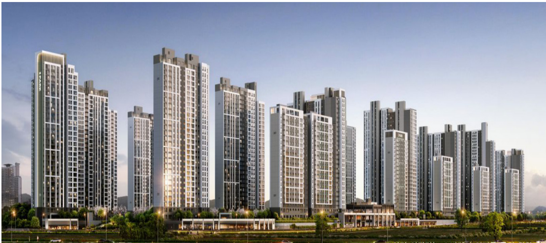
▲ ‘운정 아이파크 시티’ 투시도.